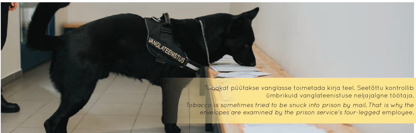
Tubakat püütakse vanglasse toimetada kirja teel. Seetõttu kontrollib ümbrikuid vanglateenistuse neljajalgne töötaja. Tobacco is sometimes tried to be snuck into prison by mail. That is why the envelopes are examined by the prison service's four-legged employee.

The first attempts by prisoners to avoid the smoking ban through litigation have not proved fruitful. The Supreme Court has not yet deliberated on this matter in substance as part of the constitutional review court procedure, but might in the future.